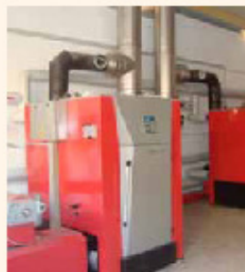
Hackschnitzel-Feuerungsanlagen (2 x 150 kW)

Der rund 20.000-Seelen-Ort Senden ist eine der vorbildlichsten Gemeinden Deutschlands. In 2004 erstmals mit Silber und 2008 zum ersten Mal mit Gold ausgezeichnet, erhielt Senden am 13.10.2011 den European Energy Award zum zweiten Mal in Gold. Diese Auszeichnung erhielt Senden für die kommunale Förderung bei der energetischen Altbauersanierung, für die Gemeindliche Förderung bei der energetischen Altbauersanierung, für die Errichtung der Klimaschutzsiedlung „Buskamp“, für die Erweiterung der Solarsiedlung „Mönkingheide-Langeland“ sowie weitere Bürgerkraftwerke und für die kontinuierliche energetische Sanierung ihrer kommunalen Gebäude.