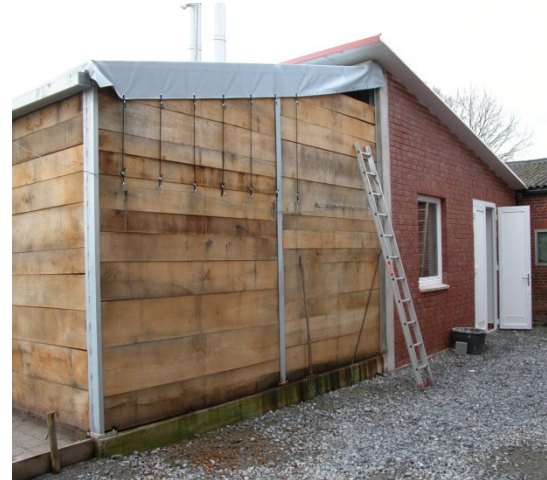
Das flexible Hackschnitzel-Vorratslager ist direkt an den Feuerungsraum angeschlossen