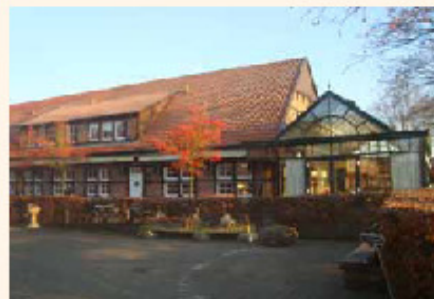
In der Gemeinde Senden liegt der Hof Grothues-Pothhoff mit seinem Hofcafé

In dieser energieengagierten Gemeinde befindet sich der Hof Grothues-Pothhoff. Der landwirtschaftliche Betrieb hat sich auf den Anbau und die Direktvermarktung von Obst und Gemüse spezialisiert. Neben dem Hofladen für die selbst erzeugten Produkte wird ein Hofcafé betrieben. Wärmebedarf besteht für die betriebseigenen Gebäude und für einige Wohnungen.