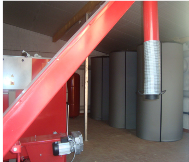
Die 2 x 150 kW Holzfeuerungsanlagen mit 3 x 2.000 l Pufferspeicher