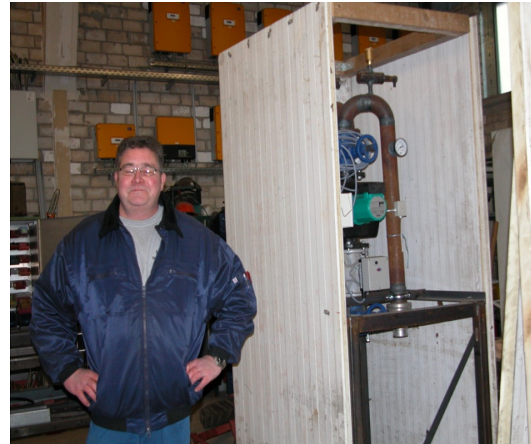
Das zukünftige Wärmeverteilsystem für die Erdbeerkulturen.